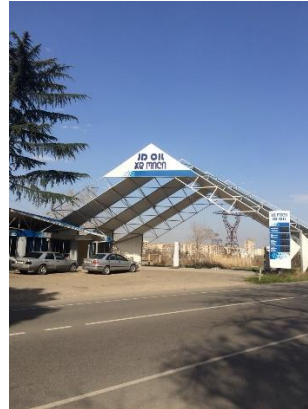
N 3 არსებული სიტუაცია