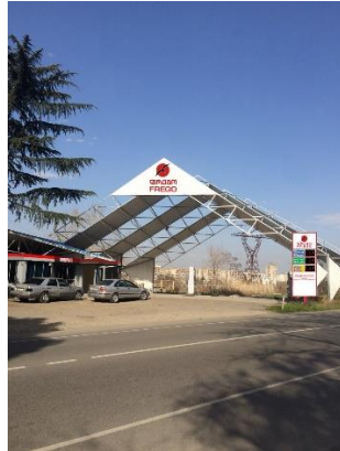
რენდერი N 2